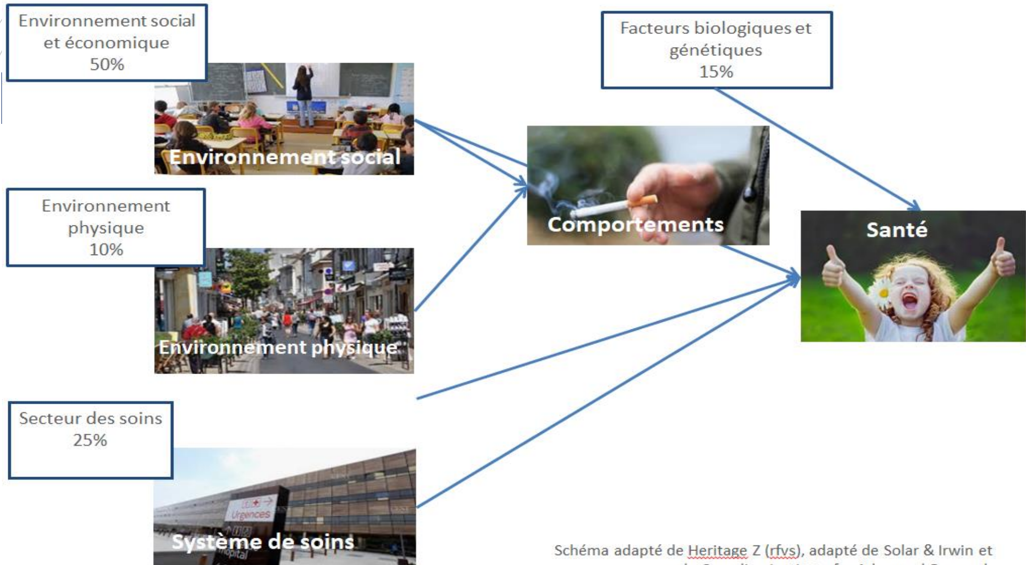
Schéma adapté de Heritage Z (rfvs) , adapté de Solar & Irwin et du Canadian Institute for Advanced Research